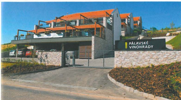
▲ Pálavské Vinohrady – byty pro rekreaci a volný čas, Pavlov u Dolních Věstonic