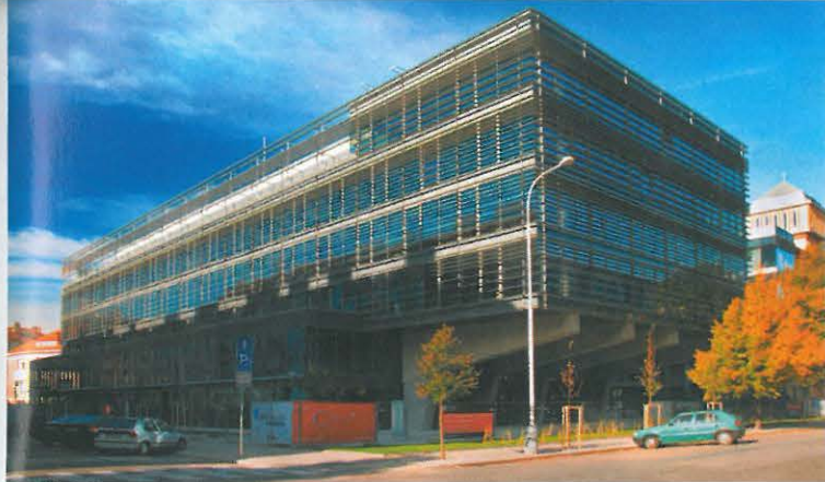
▲ Classic 7 – objekt I, administrativní budova, Praha