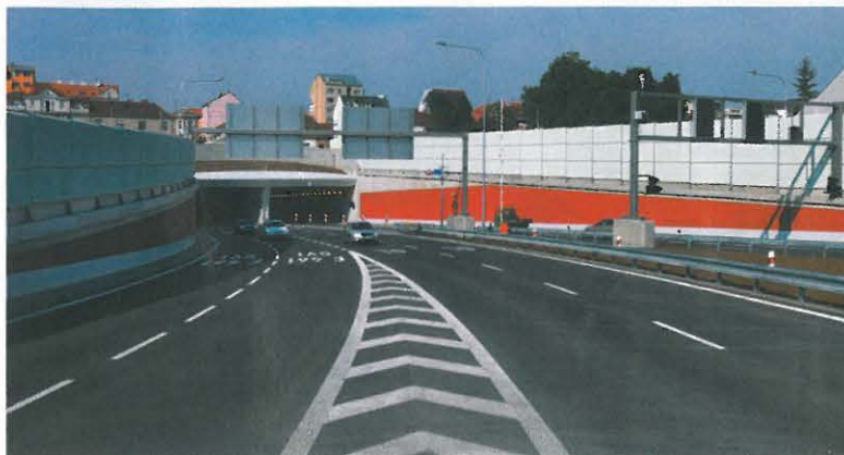
▲ Dopravní a inženýrské stavby Silnice I/42 Brno, VMO Dobrovského B