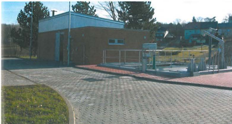
▲ Rebešovice – kanalizace a ČOV