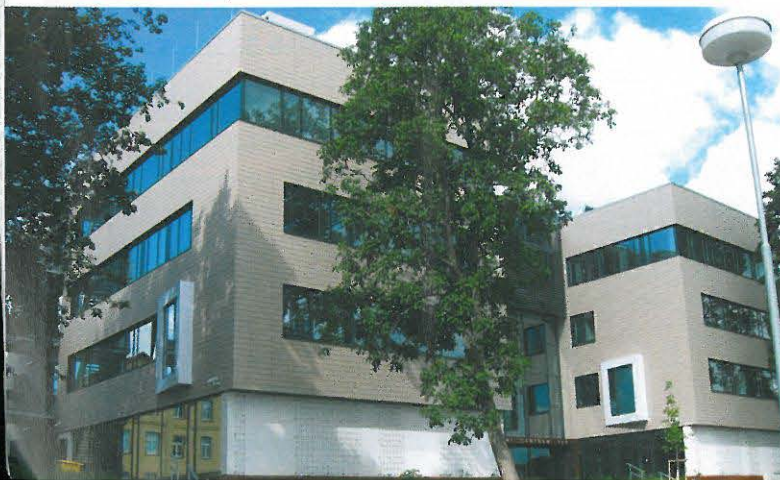
▼ VFU – Studijní a informační středisko, Brno