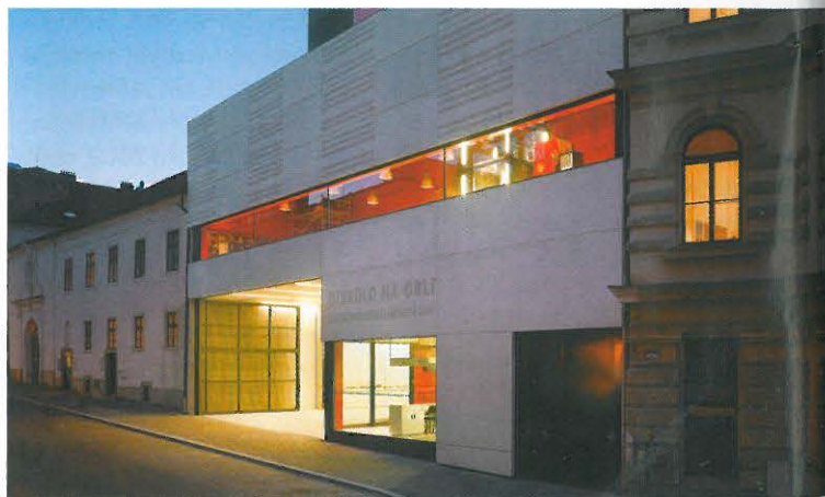
▲ Divadlo na Orlí, Hudebně dramatická laboratoř JAMU, Brno