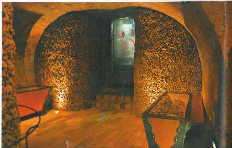
▼ Zpřístupnění brněnského podzemí – část kostnice, Brno