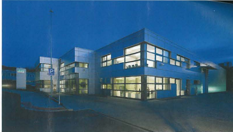
▲ Výrobní hala SK Technik, ulice Jamí – Brno